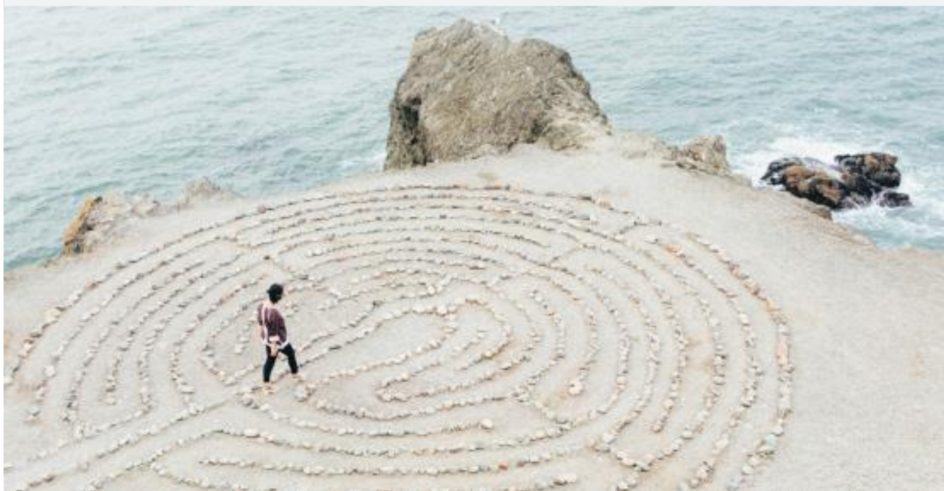
3. Slik håndterer vi risikoområdene våre.